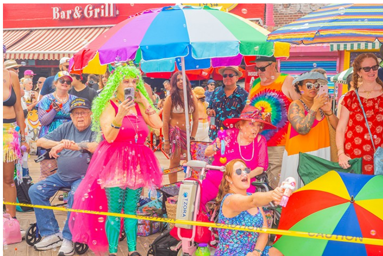
Mermaid Parade, Coney Island, Brooklyn, Giugno 2022

Lucia Buricelli è una fotografa e questa è la sua prima personale a Roma e l'ha dedicata a New York. Siamo talmente abituati ad immaginare lo skyline, i grattacieli imponenti e le luci artificiali di Broadway che, di fronte alla New York di Lucia Buricelli rimaniamo stupiti e spiazzati. Realizzati dal 2019 al 2025, questi scatti ci presentano una New York tutta a colori, colori che sembrano attinti da un grande negozio di zuccherini. Intendiamoci, non si tratta di foto ritoccate, ma di foto che evidenziano un amore gioioso per il colore. Accostamenti cromatici che farebbero rabbrivire qualsiasi sarto d'alta moda.