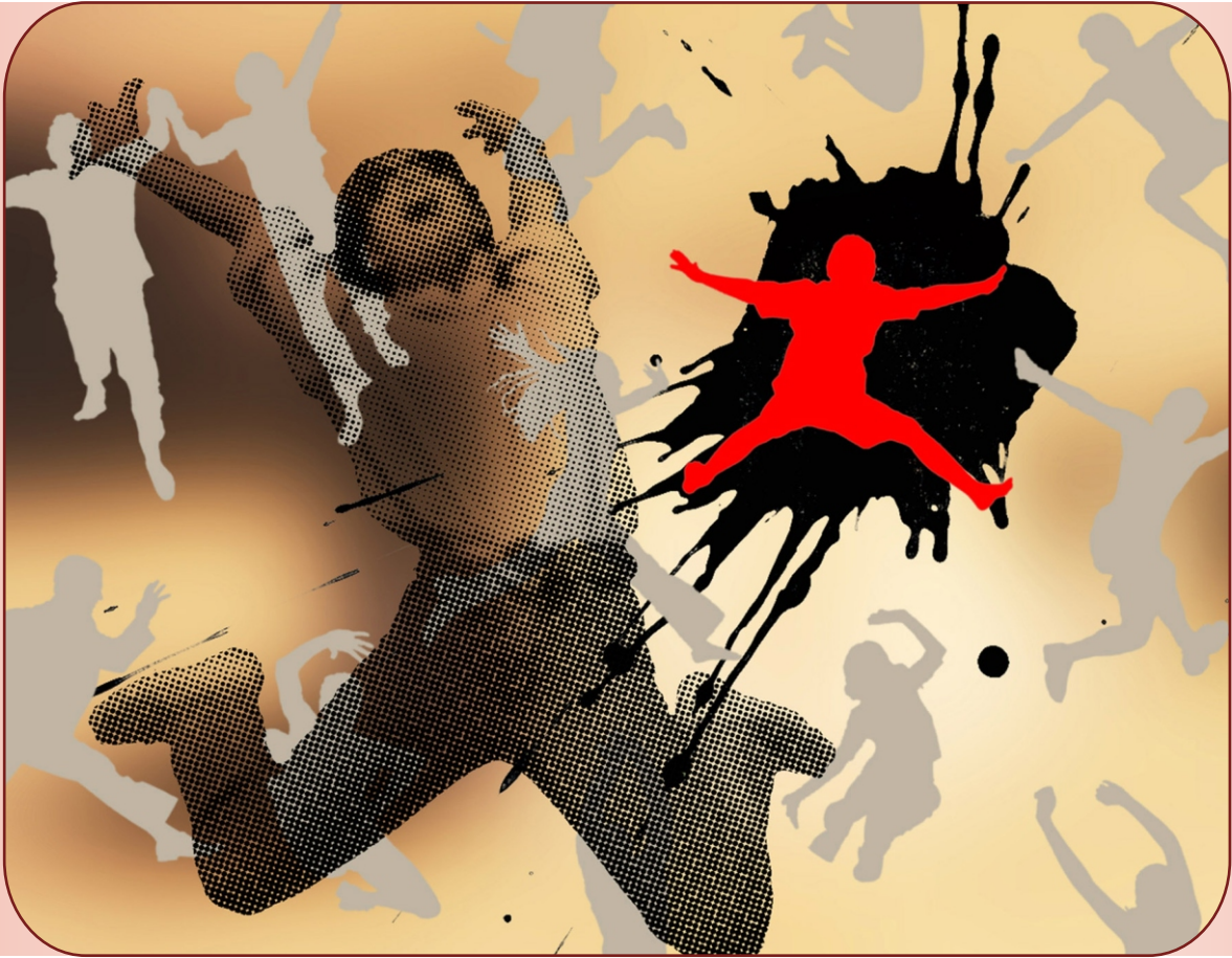
Maria Korporal ENERGY! #3, 2005

Elaborazione digitale, stampa lambda su alluminio, cm 100x130