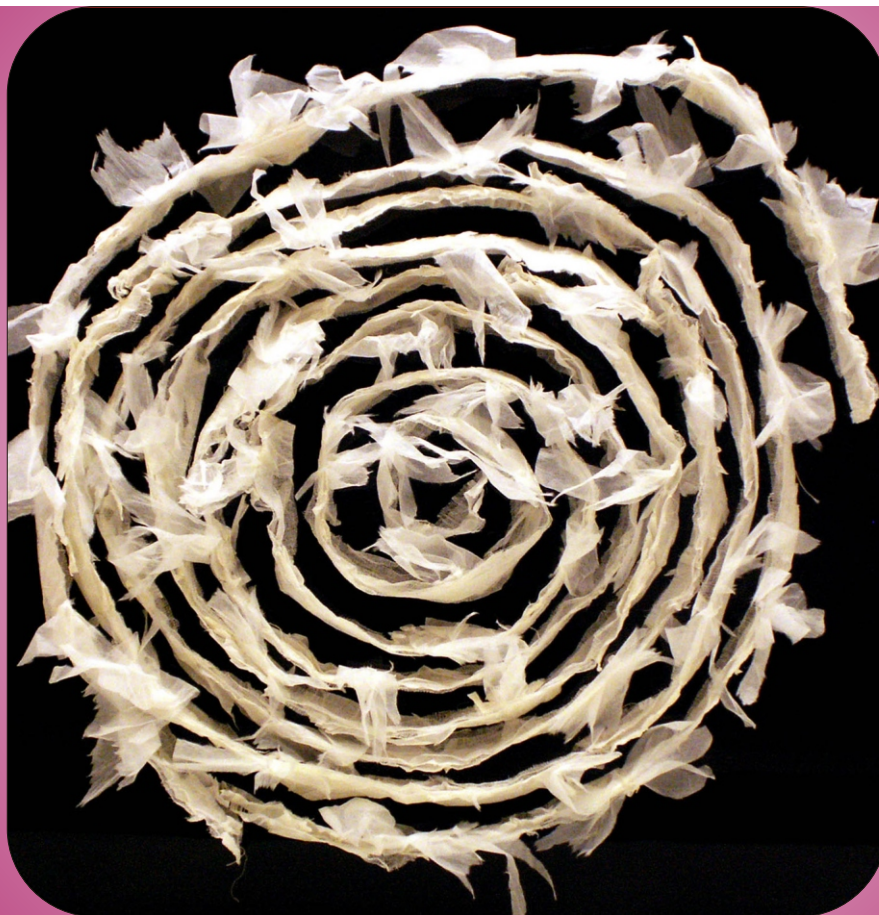
Lydia Predominato LABIRINTO/SPIRALE, 2006

cuciture a macchina, tecnica personale - plexiglass, tarlatana, carta di riso, cm.90x90x10