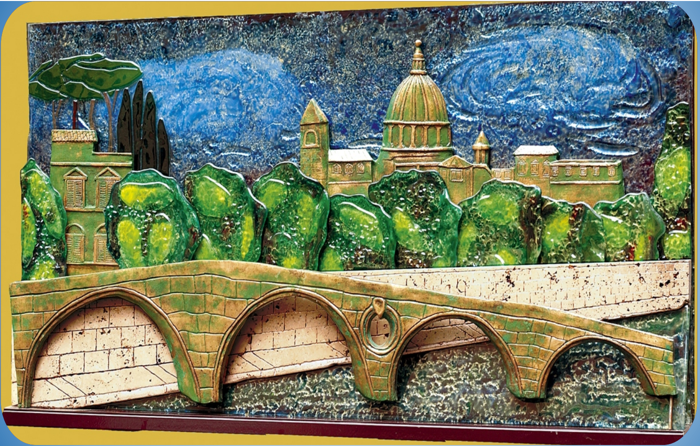
Pietro La Camera PONTE SISTO, 2004

vetrofusione a due culture con smalti vetrificati, bronzo e marmo travertino su supporto di ferro smaltato, cm. 50x100x9