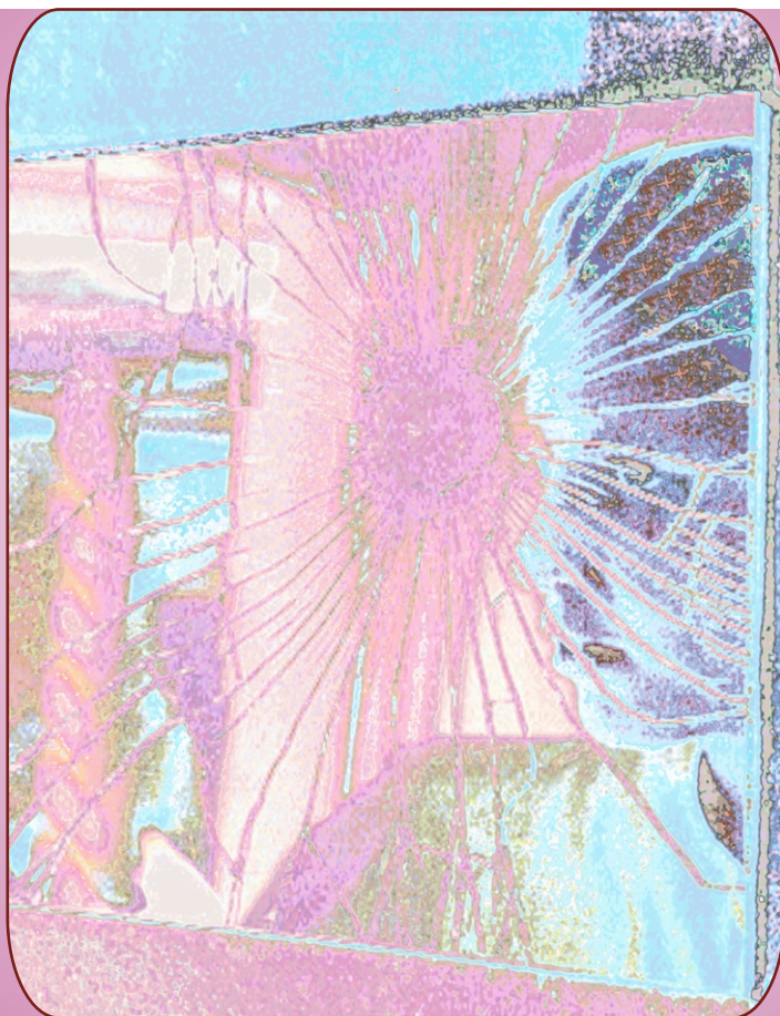
Giovanna Gandini POST POST OPERA, 2002 Elaborazione digitale cm. 85x85